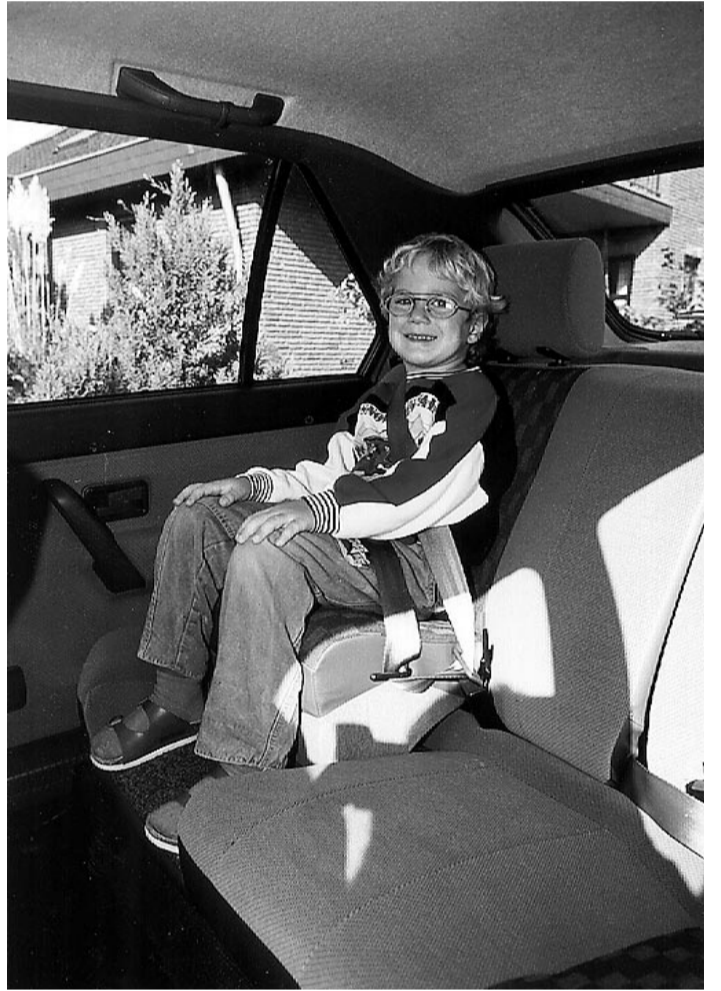
Auch auf Kurzstrecken, wie im Stadtverkehr, wo es nicht immer ruhig zugeht, wie viele meinen, sind Kinder gut zu sichern.